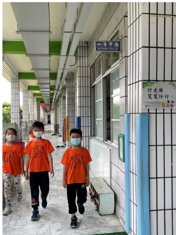
閩南語校園空間情境布置-提醒標語 (佇走廊寬寬仔行。)