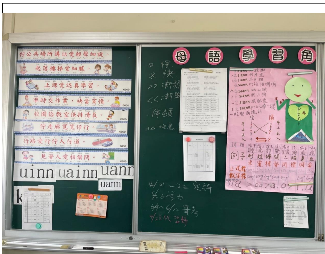
本土語言教室情境布置