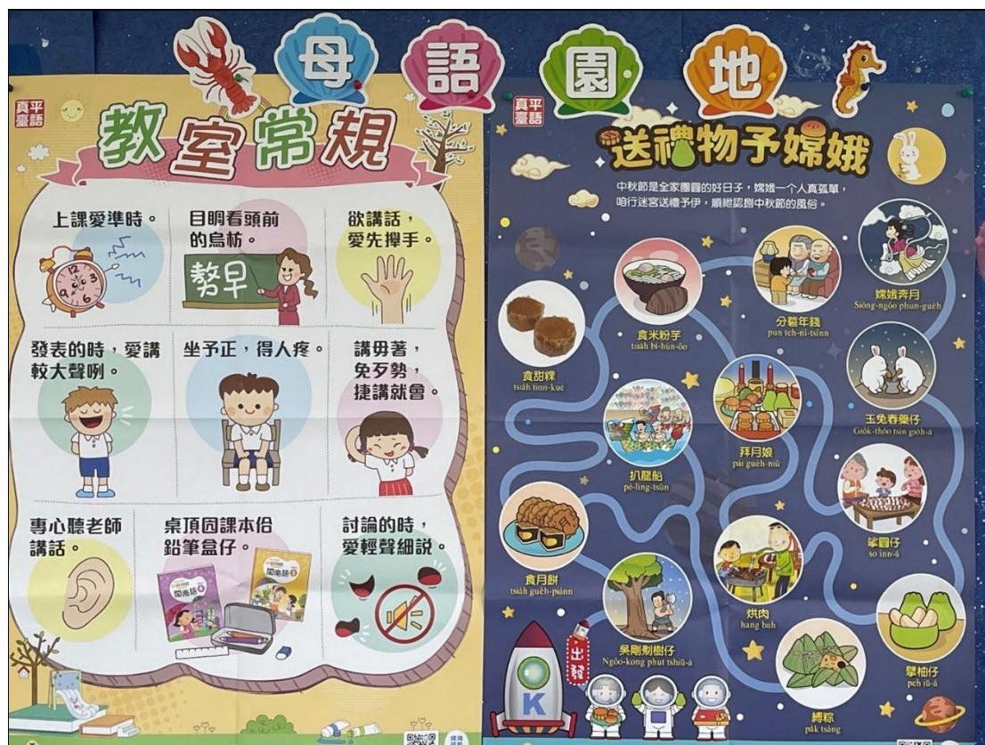
本土語言教室情境布置