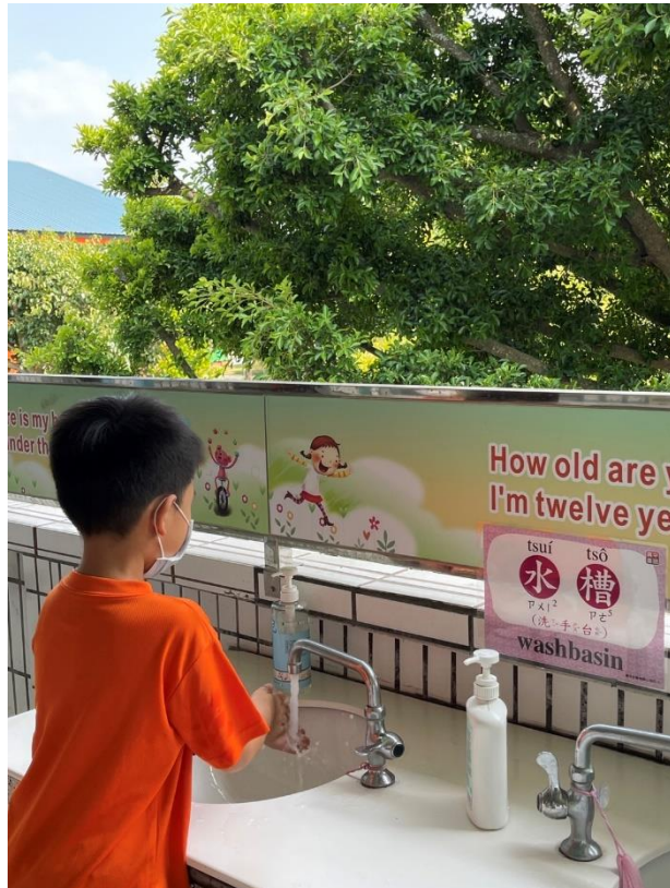
閩南語校園空間情境布置-水槽