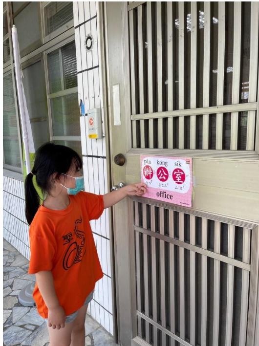
閩南語校園空間情境布置-辦公室