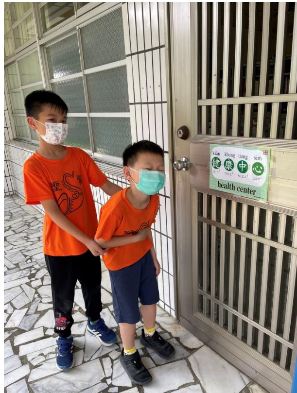
閩南語校園空間情境布置-健康中心