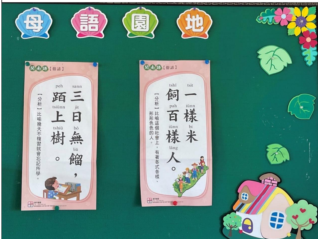
本土語言教室情境布置