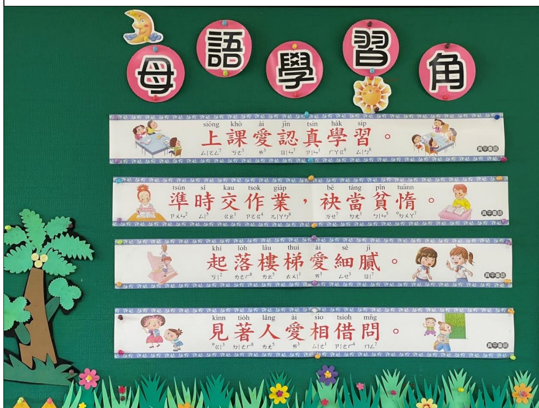
本土語言教室情境布置