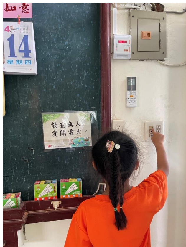
閩南語校園空間情境布置-提醒標語 (教室無人愛關電火。)