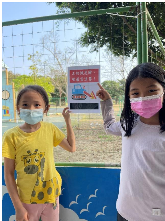
閩南語校園空間情境布置-工地施工中