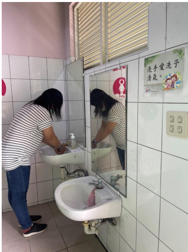
閩南語校園空間情境布置-提醒標語 (洗手愛洗予清氣。)