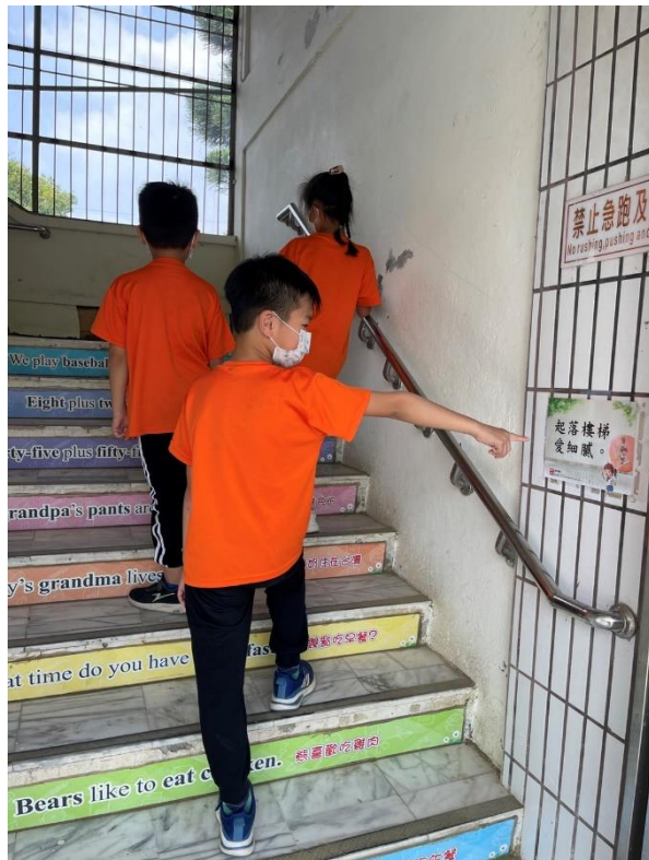
閩南語校園空間情境布置-提醒標語 (起落樓梯愛細膩。)