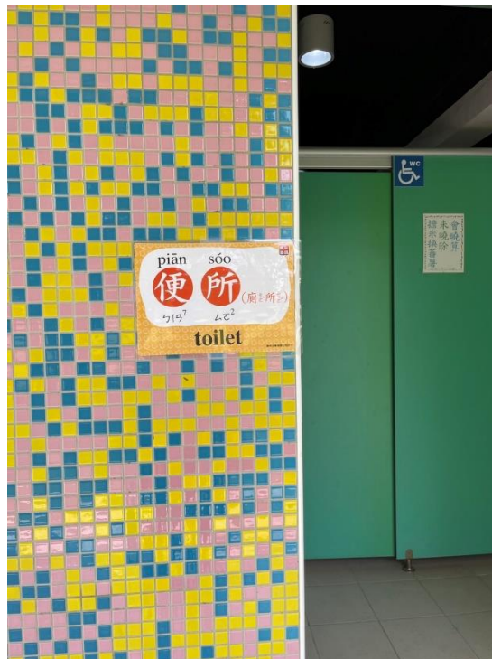
閩南語校園空間情境布置-便所