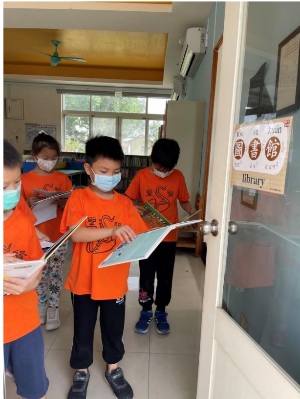
閩南語校園空間情境布置-圖書館